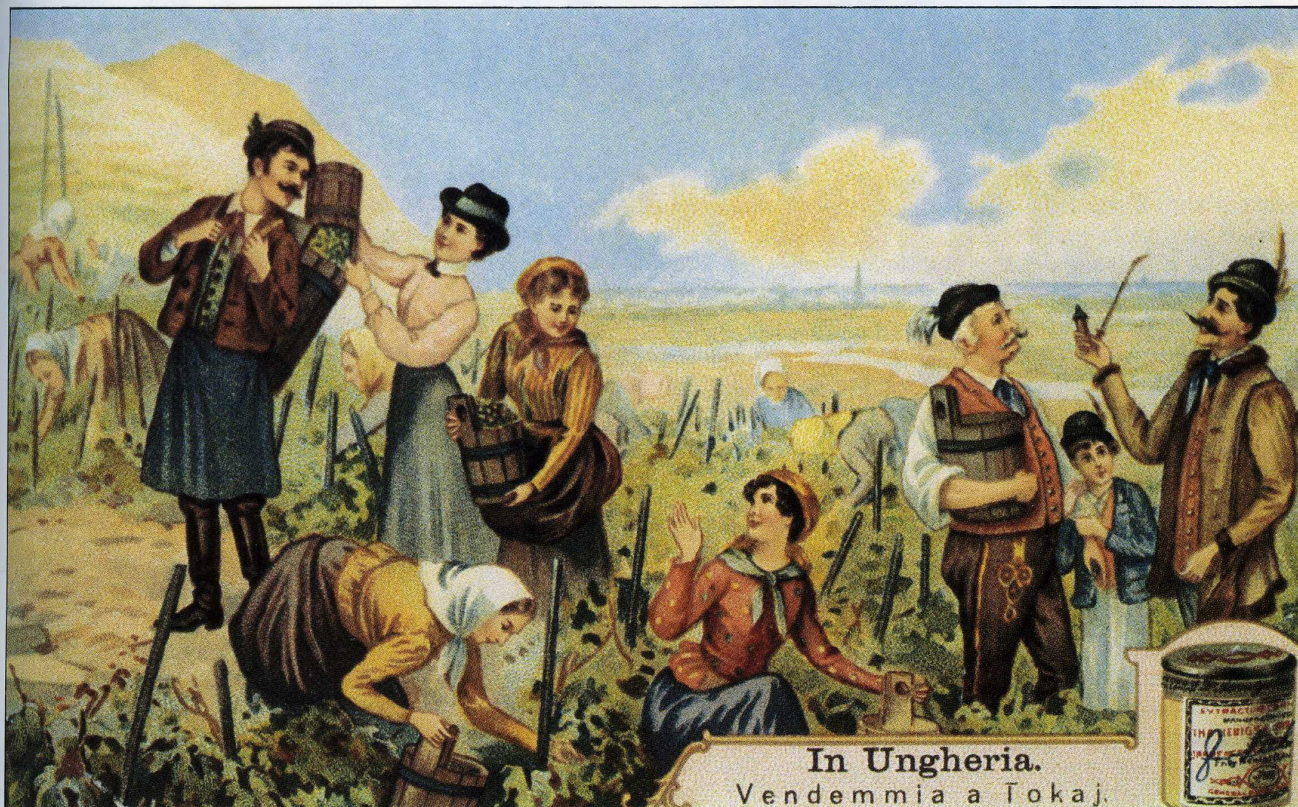
In Ungheria. Vendemmia a Tokaj.

tichiamo che siamo sempre in Friuli) con centro a Lison ed in provincia di Udine, soprattutto nella zona collinare orientale ».